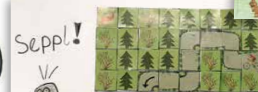
Maurice Oppelt aus Pfarrwerfen