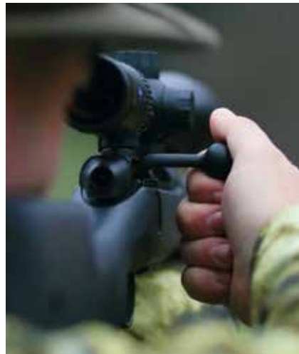
Dank 60-Grad-Öffnungswinkel steht der Kamerstängel beim Repetieren waagrecht ab und erlaubt so auch niedrige Montagen.