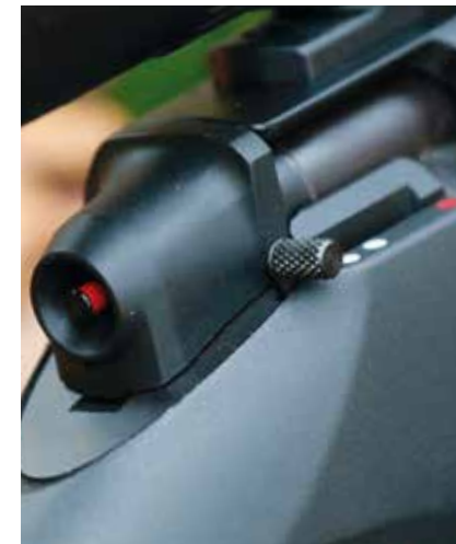
Die 3-Stellungs-Sicherung wirkt auf den Abzugsstollen. Die Spannanzeige am Ende der Kammer ist seh- und fühlbar.