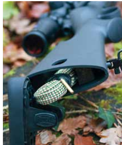
Hinter der abnehmbaren Schaftkappe verbirgt sich genug Platz, um etwa eine Putzschur oder Ähnliches unterzubringen.