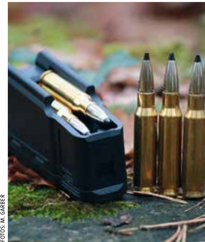
Fünf plus eins: Das kompakte zweireihige Mauser-Magazin bietet Platz für fünf Patronen plus eine im Lauf.