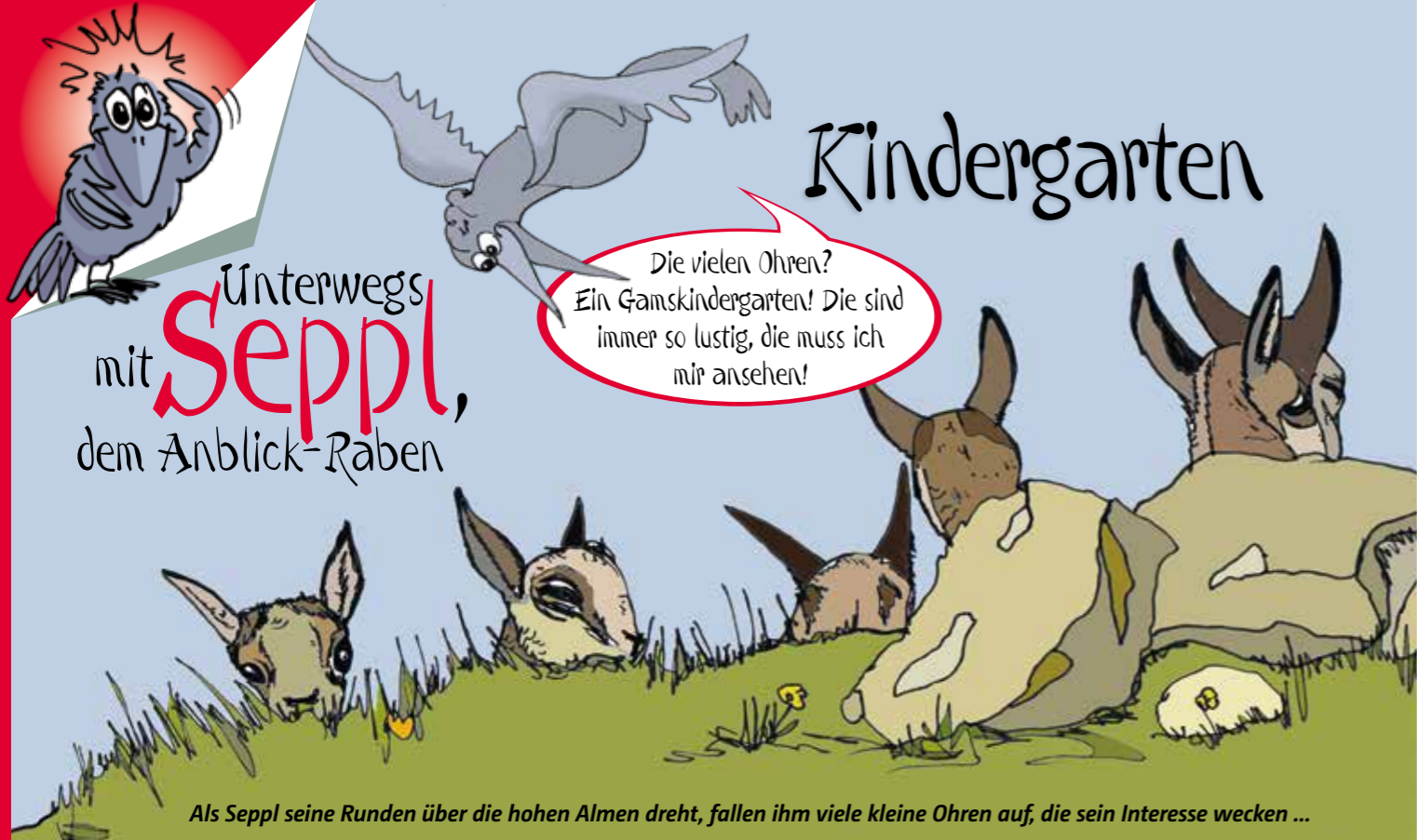
Als Seppl seine Runden über die hohen Almen dreht, fallen ihm viele kleine Ohren auf, die sein Interesse wecken ...

Die vielen Ohren? Ein Gamskindergarten! Die sind immer so lustig, die muss ich mir ansehen!