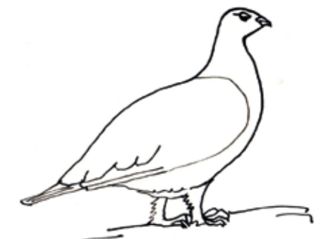
Hahn im Winter