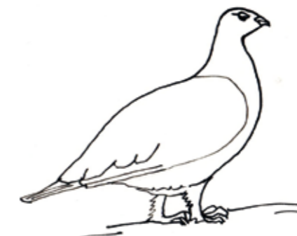
Hahn im Sommerkleid