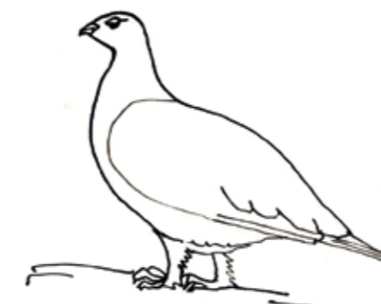
Henne im Sommerkleid